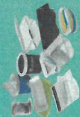
Pots et barquettes

⚡ Pour gagner de la place, pensez à aplatir vos bouteilles !