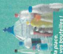
Bouteilles et flacons

EMBALLAGES PLASTIQUES À déposer en vrac, non imbriqués & bien vidés