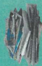
Papiers, journaux, magazines