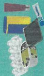
Boîtes et tubes