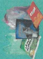
Sacs, sachets et films